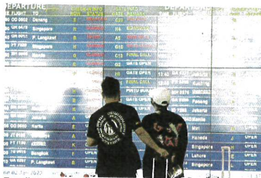
Travellers checking the flight schedule and status at the Kuala Lumpur International Airport in Sepang yesterday. Health Minister Dr Zaliha Mustafa says the cabinet will discuss the issue of Chinese tourist arrivals following a surge in Covid-19 cases in China and the reopening of its borders.

The ministry previously announced that all visitors entering the country would have to undergo temperature screening