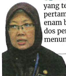
Dr Zaliha Mustafa, Menteri Kesihatan

KKM menggesa orang ramai yang telah menerima dos penggalak pertama yang melebihi tempoh enam bulan agar mendapatkan dos penggalak kedua serta tidak menunggu vaksin bivalen