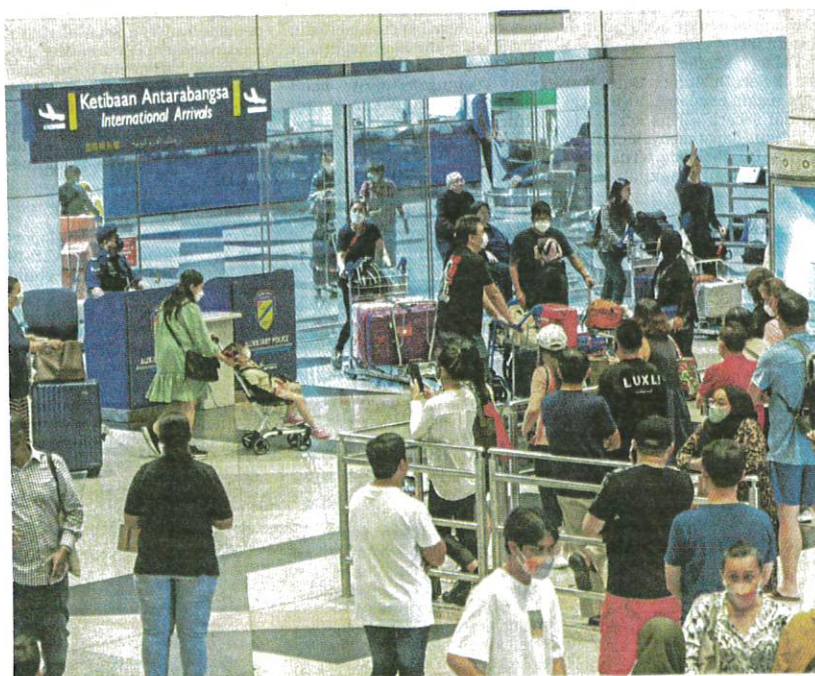
KKM sedia mengubah dasar penjagaan kesihatan pengurusan pandemik COVID-19, termasuk memperketat SOP pemeriksaan kesihatan di pintu masuk negara.

"Daripada 288 sampel positif Omicron itu, 32 (11.1 peratus) telah lengkap ujian WGS dengan sublineage dominan yang dikesan ialah BA.5; BA.2; BA.2.75 dan BA.2.12," katanya.