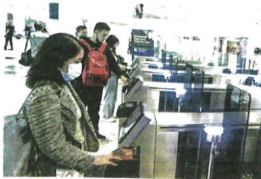
MALAYSIA menetapkan pengembara yang tiba dari luar negara termasuk China perlu melalui saringan demam di pintu masuk antarabangsa (PMA). – GAMBAR HIASAN

"Ketika ini hanya 49.8 peratus sahaja rakyat Malaysia yang telah mendapatkan vaksin dos penggalak pertama, manakala hanya 1.9 peratus yang telah mengambil vaksin dos penggalak kedua," tambahnya.