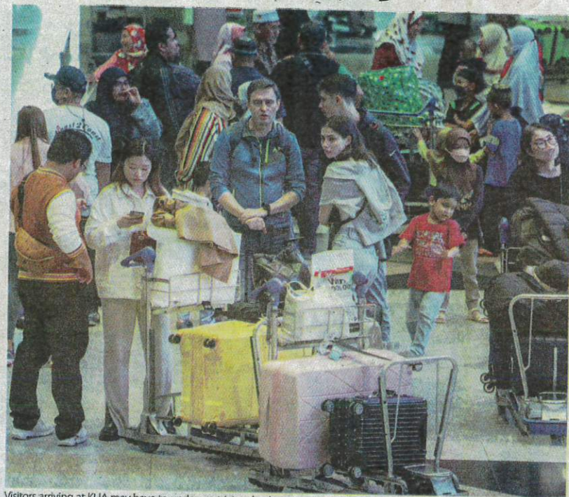
Visitors arriving at KLIA may have to undergo stricter checks soon.

"For samples from entry points, risk assessment is continually conducted to identify countries with