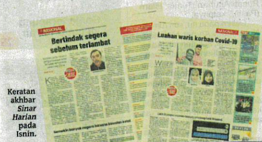
Keratan akhbar Sinar Harian pada Isnin.

namakan BF.7 dipercayai memacu lonjakan jangkitan di China.