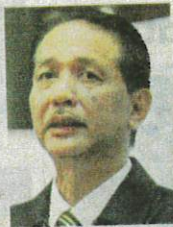
DR NOOR HISHAM

bagi sublineage Omicron BA.5 dan belum digolongkan sebagai Lineage Under Monitoring (LUM) WHO.