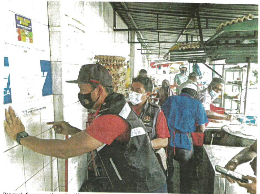
Penang's famous roti canai stall in Jalan Transfer was ordered close for 14 days over unsatisfactory hygiene conditions.

The department also noted that the premises' hygiene standards