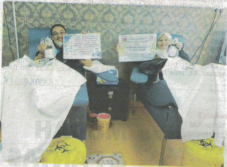
DUA individu yang menderma darah di Unit Transfusi Darah HSNZ, Kuala Terengganu semalam.

“Alhamdulillah, sewaktu banjir baru-baru ini, kita berjaya mengumpulkan sebanyak 2,000 beg darah hasil program yang dijalankan di 30 lokasi,” katanya